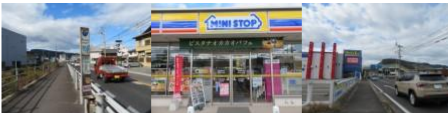
※古高松南駅への路、コンビニでカッシーチラシをコピー

④12時51分、高松 8 km、松山 164 kmと記した標識前を通過。12時59分、古高松南駅には12時59分到着する。高松行の列車がやって来る。