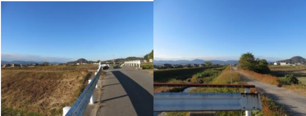
※遠くに白山が見える！！