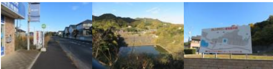
※オレンジタウン駅への路