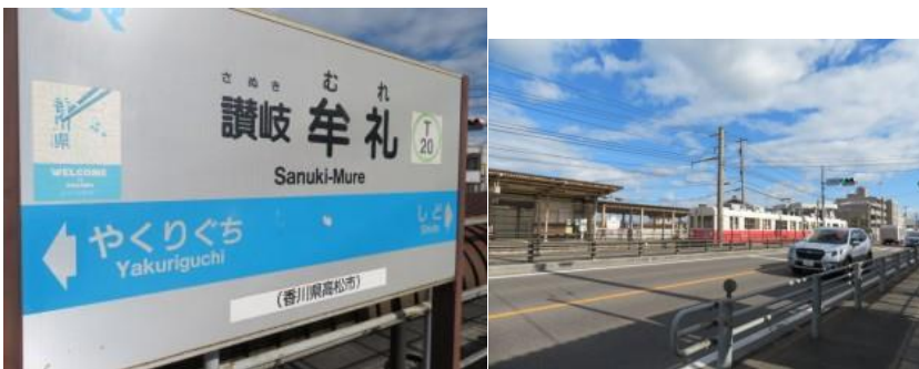
※讃岐牟礼駅、琴電八栗新道駅