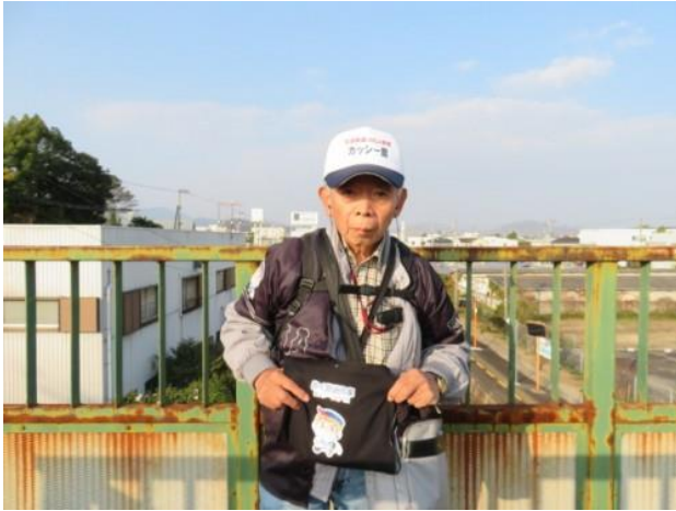
※讃岐白鳥駅のホームを跨ぐ