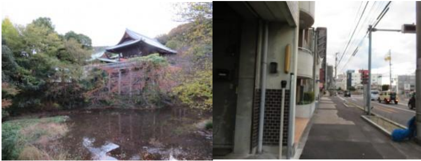
※昭和町駅への道筋