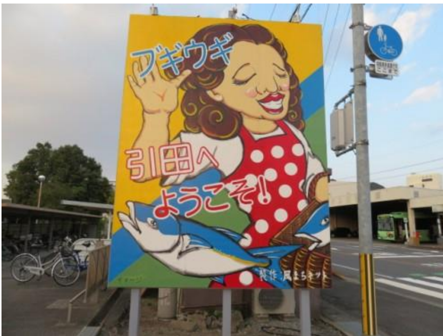
※引田駅、笠置シズ子のポスター

②7時27分、セーターを脱ぐ。7時41分、バス停がある小海川（61歩）を渡る。7時50分、右手に香川県の象徴の溜池があった。8時13分、JR線を跨ぎ鉄道の左側となる。その先に伊座バス停（大川バス）があった。このバス停で実家近くのバス停（真行寺）を確認し、香川県の鉄道つたい歩きを実感する。8時30分、香川県立白鳥病院前を通過。讃岐白鳥駅には8時40分到着。ホームにある通路を跨ぎ、鉄道の右側となる。鉄道に沿って歩いた先に白鳥神社（8時57分）がある。この神社は幼少の頃参拝した記憶があるので懐かしくなる。これまでのお礼と本日の安全を祈願する。