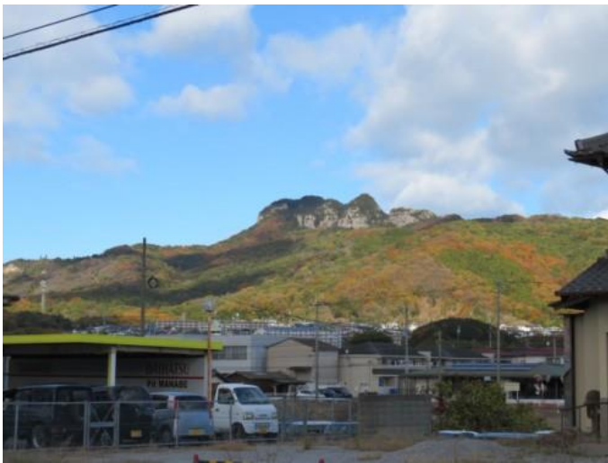
※五剣山（麓に 85 番札所八栗寺あり）

④12時51分、高松 8 km、松山 164 kmと記した標識前を通過。12時59分、古高松南駅には12時59分到着する。高松行の列車がやって来る。