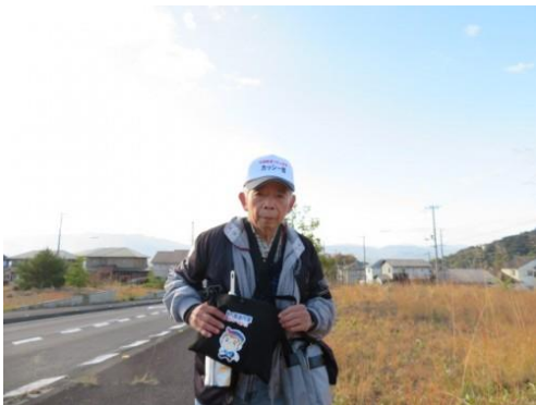
※オレンジタウン駅への路、空き地あり