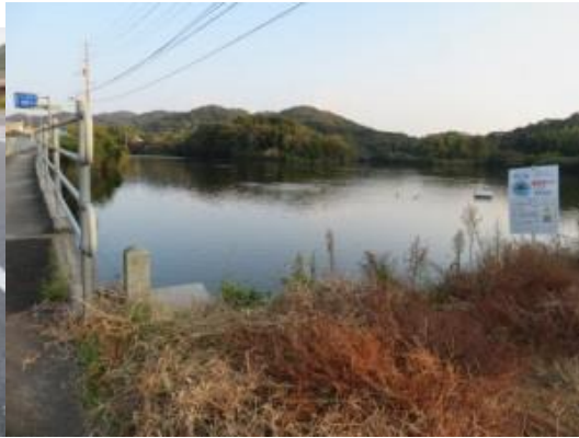
※高松 39 km、鴨のいる溜池