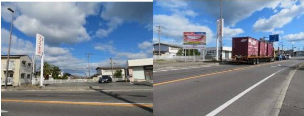
※フコク生命の看板